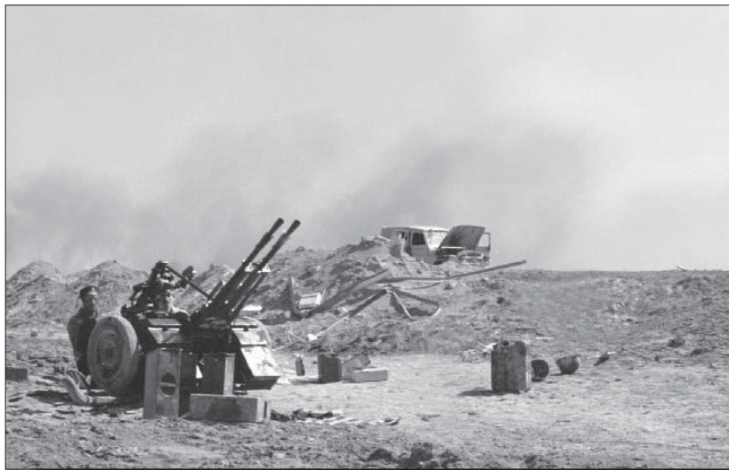
شلیک ضد هوایی برای دفع حملات هواپیماهای عراقی در منطقه عملیاتی والفجر ۸.

در جلسه‌ای که در تاریخ ۱۳۶۴/۱۱/۲۵ در قرارگاه کربلا برگزار شد، پدافند از رودخانه اروند تا سیل‌بند اول در