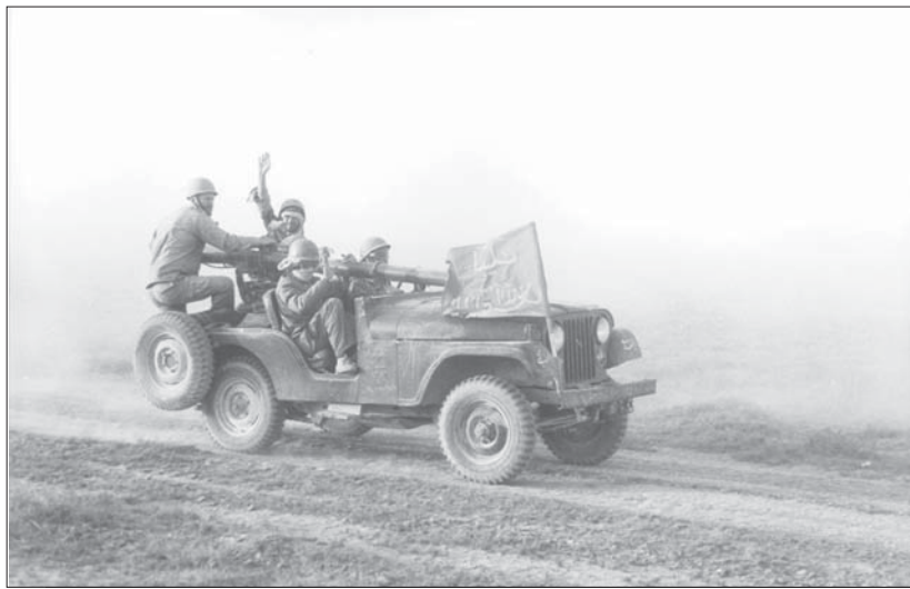
جیب مجهز به تفنگ ۱۰۶ در حال اعزام به خط مقدم - ۱۳۶۴/۱۱/۳۰.

می بایست در محور راست منطقه عملیات روی مواضع دشمن اقدام به تک می کرد. از این رو، مقرر شده بود که ابتدا یک گروهان از این گردان بعد از شکسته شدن خط توسط لشکر ۵ نصر، تک خود را آغاز و ۳۰۰ متر به سمت راست منطقه عملیات را پاکسازی کند. جهت ادامه عملیات نیز می بایست گروهانهای دیگر به سرعت وارد منطقه می شدند و در امتداد دژ اول و جاده حرکت کرده، کار پاکسازی را انجام می دادند و سپس ۵۰۰ متر بالاتر از نهر الخشی، پشت جاده شنی، به ارتفاع نیم متر و دژ دوم به صورت یک زاویه ۹۰ درجه به پدافند می پرداختند.