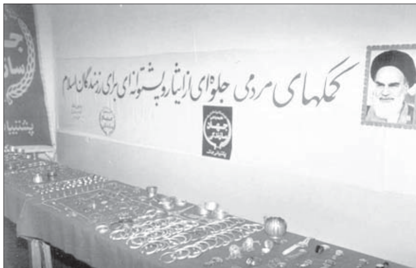
واحد جمع‌آوری و ارسال کمک‌های مردمی جهاد سازندگی، نظارت مراحل جذب، هدایت و توزیع کمک‌های مردمی را بر عهده داشت.