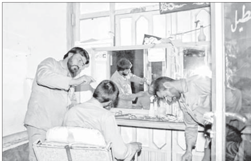
در آغاز جنگ، اصلاح سر و صورت در جبهه‌ها به‌دست رزمندگان انجام می‌شد، اما جهاد با اعزام آرایشگران به جبهه‌ها نیاز به پیرایش را مرتفع کرد.

- برپایی مراسم و مجالس سوم، هفتم و اربعین شهدا.