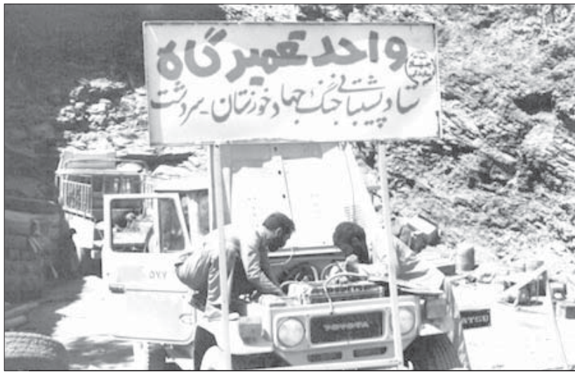
باتوجه به استهلاک بالای ادوات نظامی در جنگ و تحریم وضع شده برای ایران در زمینه تامین قطعات، جهاد سازندگی پنج کارگاه و تعمیرگاه بزرگ در پنج منطقه جنگی تأسیس کرد.