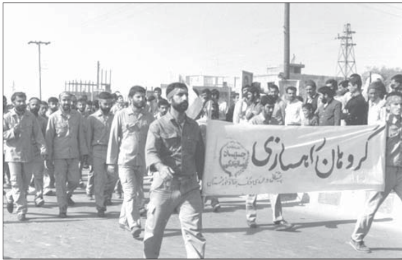
واحد اعزام نیروی جهاد سازندگی، وظیفه‌گزینش و اعزام نیروهای داوطلب را داشت.