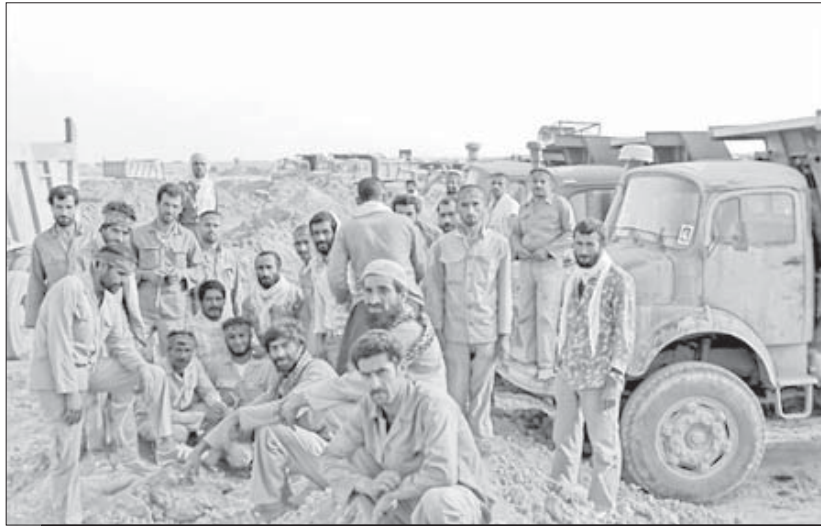
واحد اعزام خودروهای سنگین جهاد سازندگی، وظیفه داشت اعزام مردمی کامیون‌ها، کمپرسی‌ها، اتوبوس‌ها و رانندگان آنها را ساماندهی کند.

در اکثر مناطق که در شهر بمباران می‌شد، با تمام توان و امکانات شرکت می‌کردیم و دوشادوش مردم نسبت به نجات مجروحین و آسیب‌دیدگان کمک می‌کردیم. لحظاتی که به دنبال انسان‌ها در زیر آوار می‌گشتیم، ولی نشانه‌ای از آنها پیدا نمی‌کردیم ولی می‌دانستیم که در زیر خاک‌ها مدفون شده‌اند، سخت‌ترین زمان برای ما بود، چون ممکن بود ناخواسته هر لحظه باعث فروریختن مکان دیگری بشویم. خوشبختانه برادران هلال‌احمر دستگاه‌هایی در اختیار داشتند که وجود هر موجودی در زیر خاک‌ها تقریباً مشخص می‌گردید و این وسیله برای جهادی‌ها کمک خوبی بود. و طی تحقیقاتی که از همسایه‌ها و یا فامیل‌ها و اطرافیان به عمل می‌آوردیم، حدود و محل مخفیگاه خانواده‌ها را پیدا می‌کردیم. و این می‌توانست نشانه خوبی برای عملیات خاک‌برداری و آواربرداری باشد. این عملیات در تمام مناطق بمباران‌شده شهر همدان ادامه داشت و حداکثر مناطق حضور برادران جهادگر بسیار چشمگیر و قابل تقدیر بود؛ حتی در بعضی از