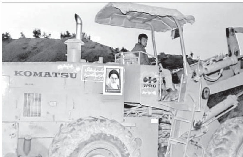
واحد آموزش جهاد سازندگی، دوره‌های تخصصی مهندسی جنگ را در پادگان‌های آموزشی برگزار می‌کرد.