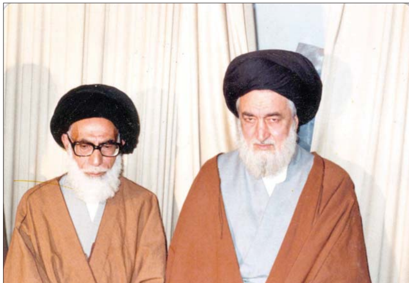
از راست آیت‌الله مدنی امام‌جمعه تبریز و آیت‌الله دستغیب امام‌جمعه شیراز از شهدای محراب

اگرچه نماز جمعه در دوران قاجار و پهلوی به‌واسطه اینکه امامت جمعه از طریق حکومت منصوب می‌شد و حاکمان این دوره‌ها مورد تأیید علما و فقها نبودند و همچنین امامان جمعه نیز غالباً از مقبولیت عموم برخوردار نبودند، این امر چندان رونق نداشت. ۱۸ اما بعد از پیروزی انقلاب اسلامی با تدبیر امام خمینی (۵) این امر رونق یافت و امام خمینی (۵) برای اقامه نماز جمعه نمایندگان را به شهرهای مختلف اعزام کرد و چون انقلاب و حکومت جدید به رهبری امام