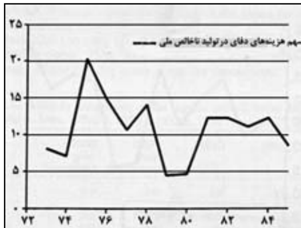
نمودار شماره ۲: بودجه دفاعی ایران: ۱۹۸۵-۱۹۷۳ (۱)

کشورهای منتخب طی دوره ۱۹۷۹-۱۹۸۵ در جدول شماره ۱۱ ارائه شده است. همان طور که دیده می شود، در سال ۱۹۷۹، برای نخستین بار، حجم هزینه های دفاعی ایران در مقایسه با کشورهای دیگر که در جدول ذکر شده است، کم و بیش، قابل مقایسه اند. البته، به استثنای امریکا و یونان، که ۴/۵ درصد یا میزانی کمتر از ۴/۵ درصد از تولید ناخالص داخلی خود را صرف هزینه های نظامی کردند.